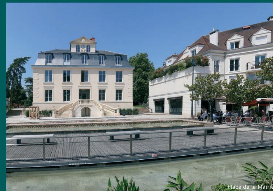
Place de la Mairie

Territoire actif du Grand Paris, Châtenay-Malabry accueille plusieurs pôles d'activités et le CREPS (Centre de ressources, d'expertise et de performance sportives d'Île-de-France). L'accès rapide à l'A86, le tramway T6 de Châtillon - Montrouge à Viroflay et la proximité de l'aéroport Paris-Orly rendent la ville très accessible.