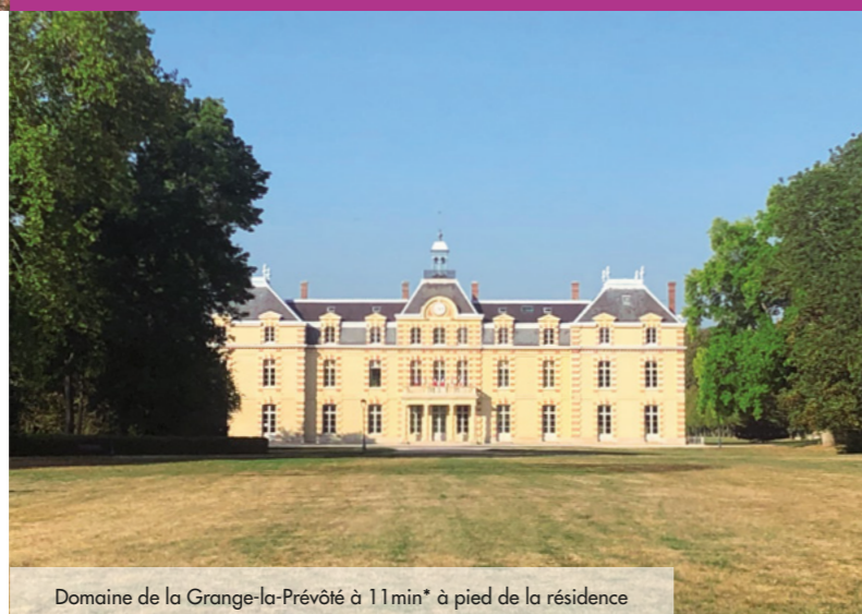
Domaine de la Grange-la-Prévôté à 11 min* à pied de la résidence