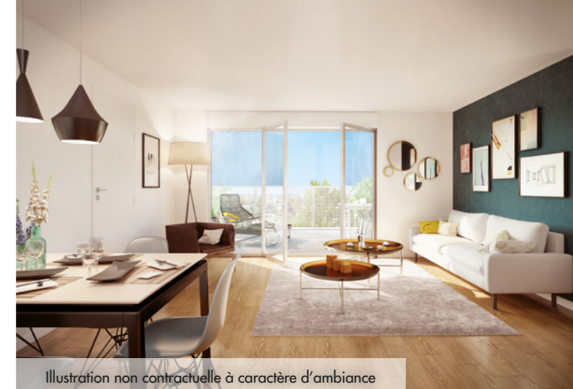
Illustration non contractuelle à caractère d'ambiance