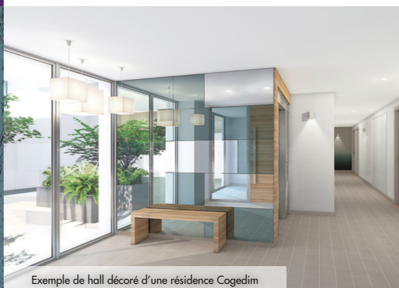
Exemple de hall décoré d'une résidence Cogedim