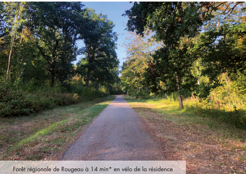
Forêt régionale de Rougeau à 14 min* en vélo de la résidence

Place du Miroir d'Eau 77176 SAVIGNY-LE-TEMPLE